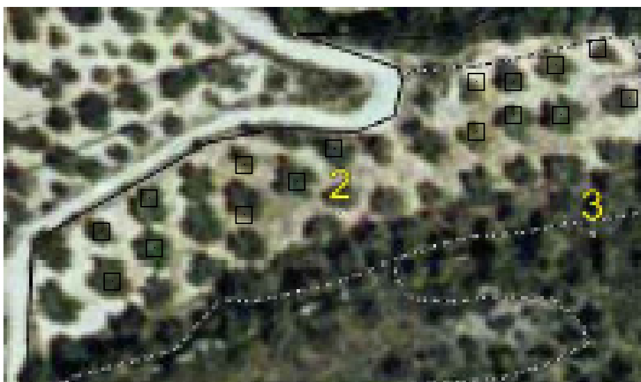
Figura 1: fotografia aèria de la finca on es fa l'experiència.