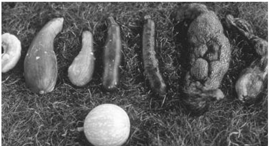
Cogombres i carbassons afectats pel ZYMV