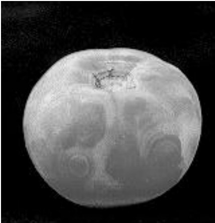
Tomàquet afectat pel TSWV

per característiques morfològiques: molts pèls poden afavorir la transmissió per contacte i l'excreció de substàncies enganxoses pot dificultar la transmissió per pugons. Els pugons també són més atrets pel color groc-verd tènue que pel verd fosc. Alhora els desagrada el fullatge brillant i reflectora i les essències molt aromàtiques d'algunes labiades (menta, espígol, etc.). Els clavells d'índies ( Tagetes ) repel·len els nematodes del sòl, també transmissors.