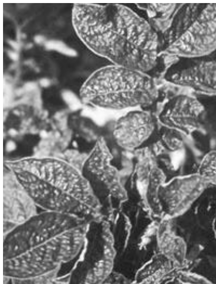
Patatera afectada pe PVY

Per millora i selecció genètica convencional, es poden introduir resistències